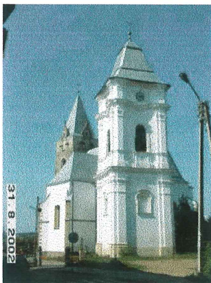
sierpień 2002 r.