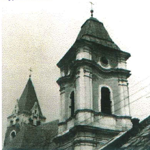
sierpień 1982 r.